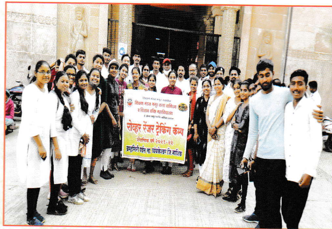
ट्रेकिंग कॅम्प ब्रह्मगिरी पर्वत