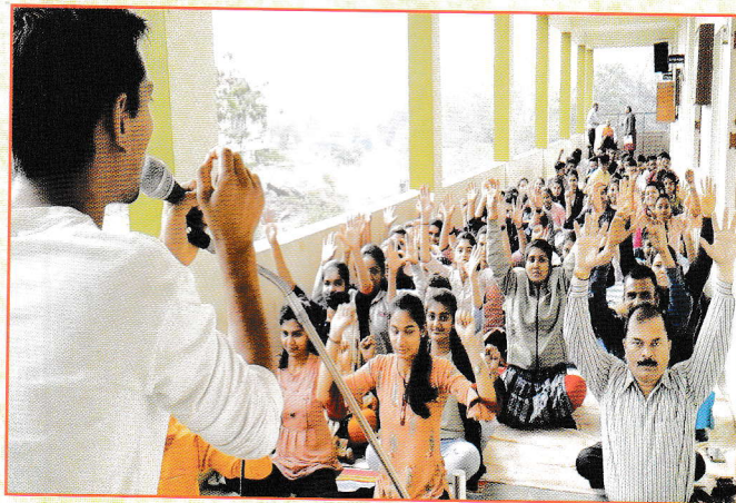
योगा प्रशिक्षण वर्ग