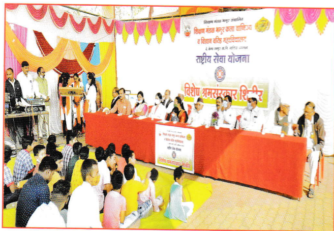
राष्ट्रीय सेवा योजनेअंतर्गत विशेष श्रम सेवा शिबीर