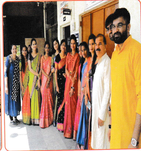
तज्ञ प्राध्यापक वृंद