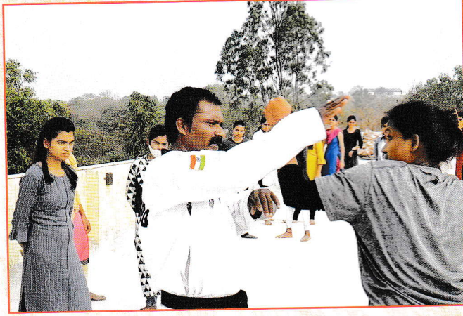
कराटे प्रशिक्षण ▶