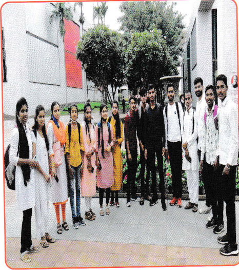
अ.भा. मराठी साहित्य संमेलनास भेट